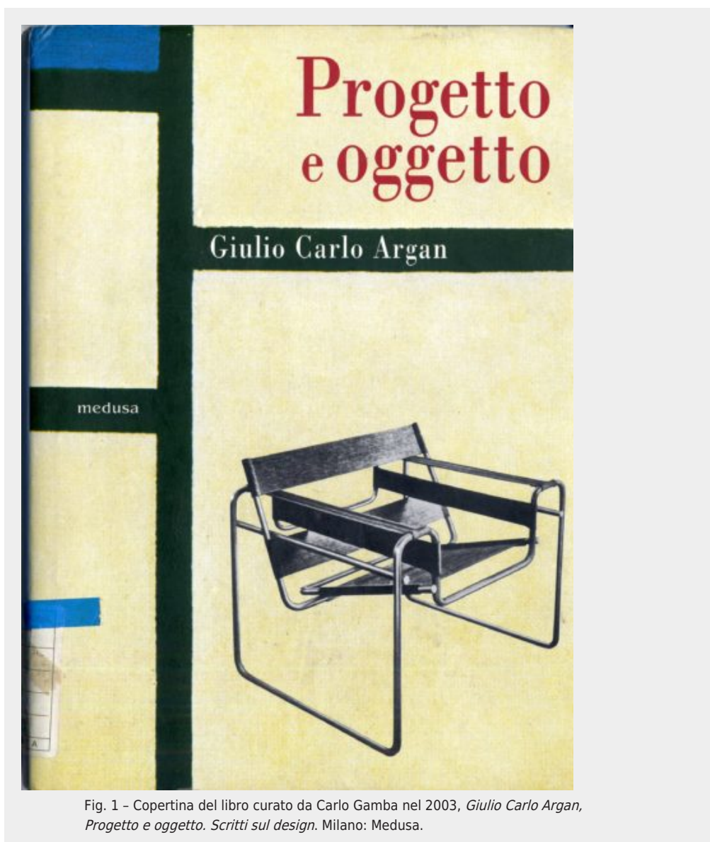
Fig. 1 - Copertina del libro curato da Carlo Gamba nel 2003, Giulio Carlo Argan, Progetto e oggetto. Scritti sul design . Milano: Medusa.

La prima è dettata dal convincimento di riguadagnare quanto uno dei maggiori storici dell'arte del Novecento ha riservato alla comprensione delle relazioni che intercorrono tra design, arte, artigianato e industria. Pur considerando che le esplorazioni dedicate da Argan al design - soprattutto concentrate tra gli anni Cinquanta e Sessanta - non sono numerose, nondimeno illustrano un particolare snodo critico della riflessione rivolta alle arti applicate e sono sufficienti da incidere nell'avvio disciplinare e formativo del design in Italia.