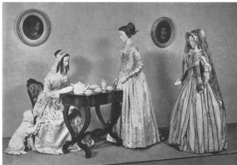
ABOVE: The hostess wears a full-skirted brown taffeta dress of 1858 with floral stripes in black, the boy a tan broadcloth suit and embroidered white shirt. The guest has on a blue moiré dress and a cashmere shawl of the 1860's. BELOW: The lady serving tea wears brocaded satin and a lace barbe of the 1840's. The guests are in orchid satin and tan-and-green silk.