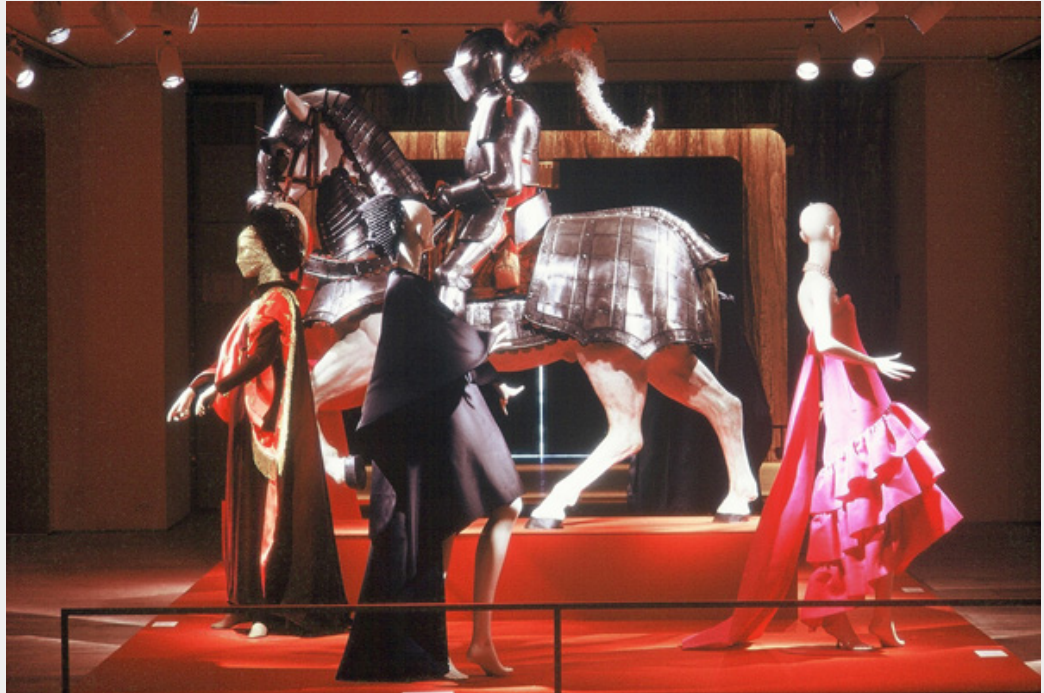
Fig. 4. L'ingresso della mostra The World of Balenciaga a cura di Diana Vreeland, New York, The Costume Institute, 23 marzo-9 settembre 1973.

della storia, e le ha trasformate in un'esperienza estremamente divertente e piacevole per i visitatori (p. 27). [19]