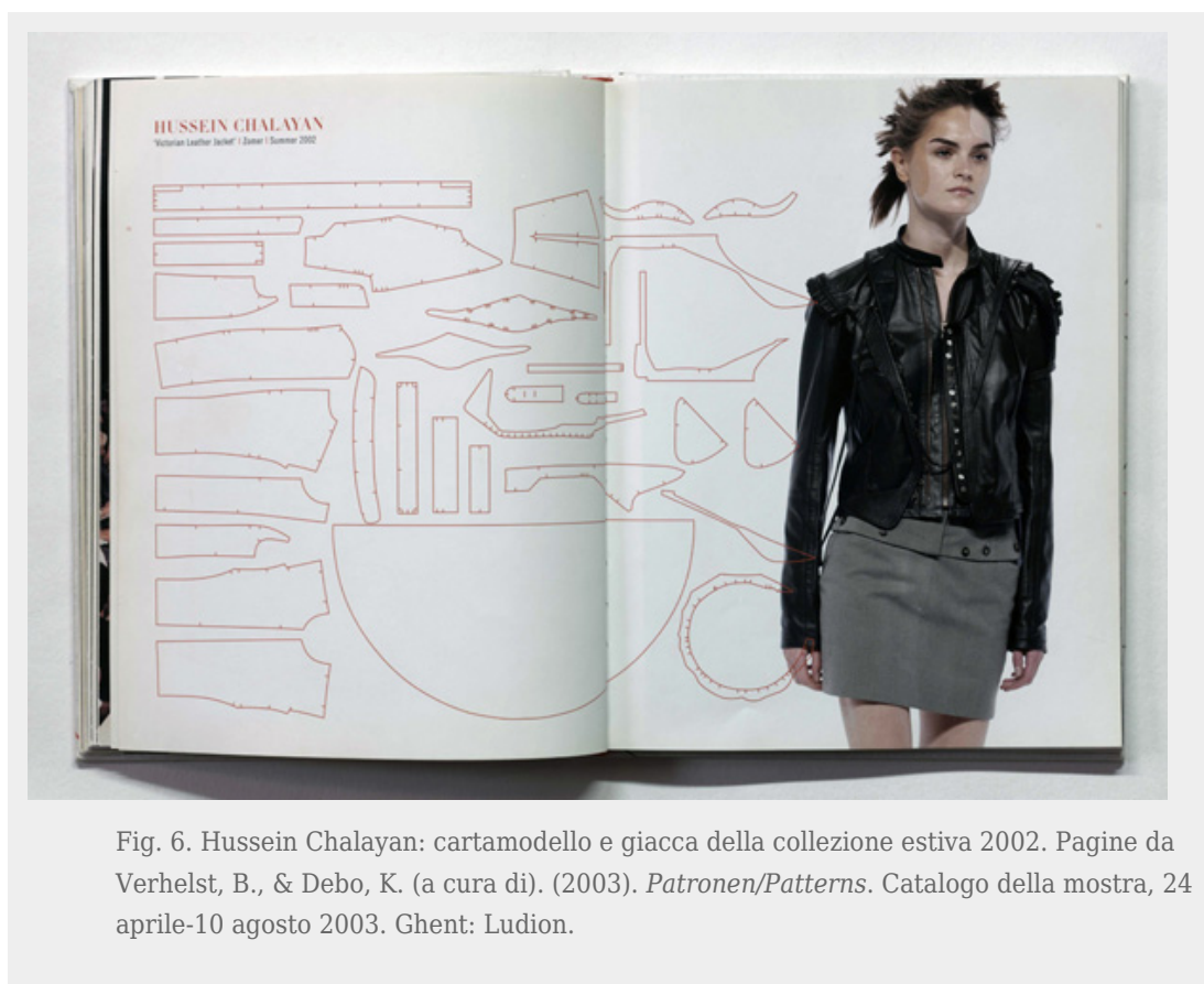
Fig. 6. Hussein Chalayan: cartamodello e giacca della collezione estiva 2002. Pagine da Verhelst, B., & Debo, K. (a cura di). (2003). Patronen/Patterns . Catalogo della mostra, 24 aprile-10 agosto 2003. Ghent: Ludion.

Si tratta di un approccio curatoriale molto interessante ed estremamente attuale che, in anni recenti, ha caratterizzato in particolar modo l'attività del MoMu di Anversa (ModeMuseum), che non a caso ha dedicato nel 2003 una mostra al cartamodello e alla modellistica. Dall'inaugurazione nel 2002, la programmazione espositiva del museo, dedicato esclusivamente alla moda, ha volutamente aggiunto ai tradizionali modelli di mostra (la retrospettiva dedicata a un autore, la mostra tematica, quella dedicata a un determinato periodo storico) progetti espositivi in grado di interrogare il linguaggio della moda e quindi la sua definizione in quanto disciplina. [28] Se la prima mostra del MoMu nel 2002 era dedicata all'archivio del museo, al backstage, la mostra Patronen/Patterns (24 aprile - 10 agosto 2003) aveva l'ambizione di spostare l'attenzione sul cartamodello e sui processi costruttivi dell'abito, da quelli sartoriali a quelli industriali. Una riflessione sul DNA dell'abito e della moda, che in mostra si trasformava in rilettura della morfologia del vestito, perché i cartamodelli esplosi diventavano paesaggi in grado di suggerire nuove traiettorie di interpretazione dell'abito e delle sue forme (fig. 6). Come scrive nel catalogo Kaat Debo (2003), curator e attuale direttore del MoMu, la modellistica e il cartamodello sono solitamente percepiti come elementi