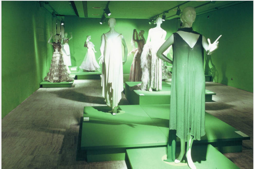
Fig. 5. Un'installazione dalla mostra The 10s, the 20s, the 30s: Inventive Clothes 1909-1939 a cura di Diana Vreeland, New York, The Costume Institute, 13 dicembre 1973-3 settembre 1974.

insieme al team tecnico del Metropolitan trasfiguravano il museo in una serie di palcoscenici, ad altezze differenti, che consentivano al pubblico di girare attorno agli abiti e a Vreeland di creare connessioni e sequenze quasi cinematografiche attraverso i manichini (e i loro gesti estremi) in mostra (fig. 5).