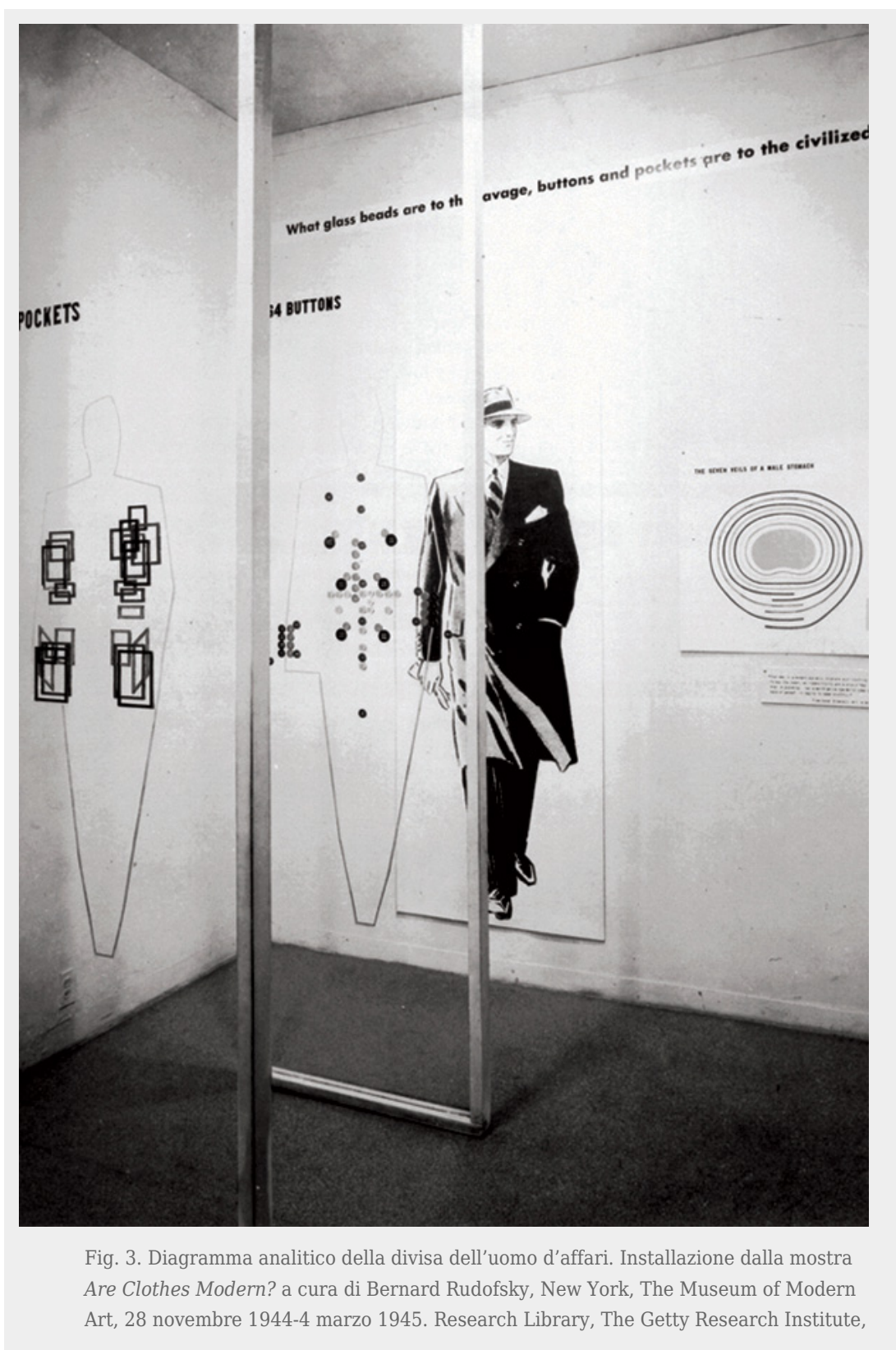
Fig. 3. Diagramma analitico della divisa dell'uomo d'affari. Installazione dalla mostra Are Clothes Modern? a cura di Bernard Rudofsky, New York, The Museum of Modern Art, 28 novembre 1944-4 marzo 1945. Research Library, The Getty Research Institute,