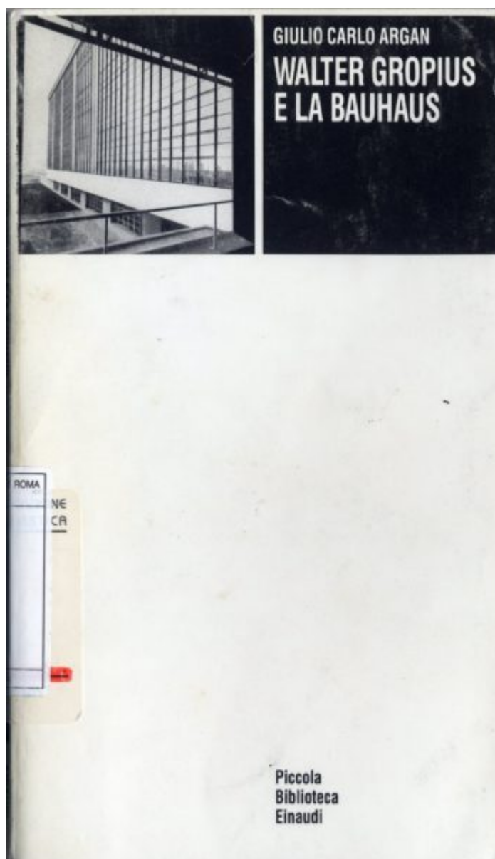
Fig. 2 - Copertina dell'edizione del 1988 del libro di Giulio Carlo Argan, Walter Gropius e la Bauhaus. Torino: Piccola Biblioteca Einaudi, edito per la prima volta nel 1951.