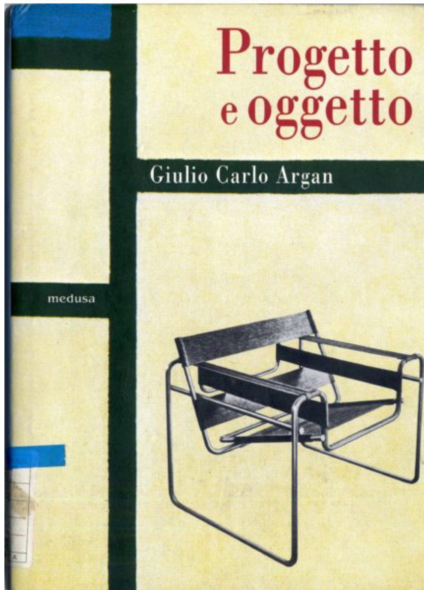
Fig. 1 - Copertina del libro curato da Carlo Gamba nel 2003, Giulio Carlo Argan, Progetto e oggetto. Scritti sul design . Milano: Medusa.

La prima è dettata dal convincimento di riguadagnare quanto uno dei maggiori storici dell'arte del Novecento ha riservato alla comprensione delle relazioni che intercorrono tra design, arte, artigianato e industria. Pur considerando che le esplorazioni dedicate da Argan al design - soprattutto concentrate tra gli anni Cinquanta e Sessanta - non sono numerose, nondimeno illustrano un particolare snodo critico della riflessione rivolta alle arti applicate e sono sufficienti da incidere nell'avvio disciplinare e formativo del design in Italia.