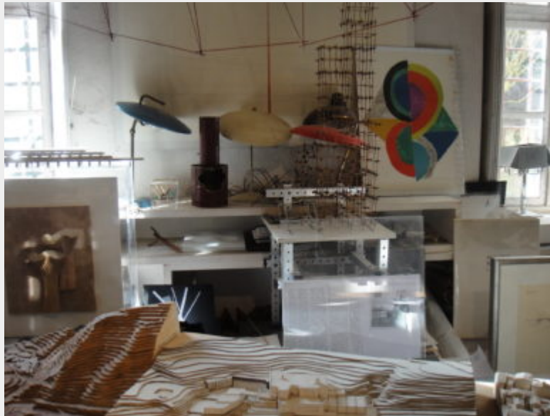
Fig. 8 - In primo piano uno dei modelli di villa Erica, immersa sul colle della Maddalena, conservato presso l'Istituto Alvar Aalto, Pino Torinese, sullo sfondo lampade in metallo di Diulgheroff e Aalto