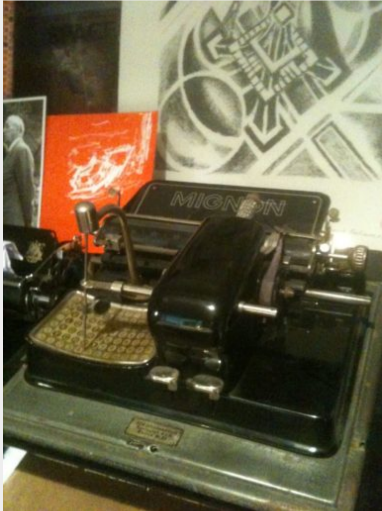
Fig. 2 - Proto-macchina per scrivere Mignon e disegno di avio-pittura