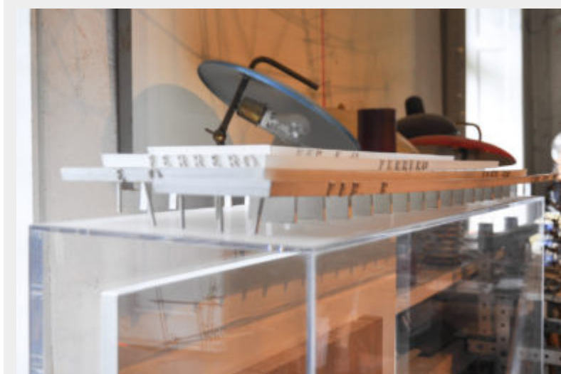
Figg. 6-7 - Particolari di uno dei modelli del prototipo di filiale e magazzini Ferrero Co. In primo piano saggi di sfibratura e piegatura del legno per le produzioni Artek, conservato negli ambienti dell'Istituto Alvar Aalto Museo dell'Architettura e delle Arti Applicate di Pino Torinese

In questo caso, sebbene il progetto rimanga sulla carta, i disegni e i modelli elaborati (in quattro varianti) raggiungono una definizione tale da consentire la chiara visualizzazione della concezione pratica e tecnica alla base della composizione architettonica. Il volume principale è dato da una struttura flessibile e componibile (grazie all'utilizzo di elementi costruttivi prefabbricati) il cui scheletro strutturale è originato dall'accostamento di una serie di portali doppi in calcestruzzo armato che sostengono le piastre di solai frangisole. La pianta invece è utilizzata come criterio ordinatore che compone lo spazio così da consentire la massima semplificazione delle operazioni connesse all'arrivo,