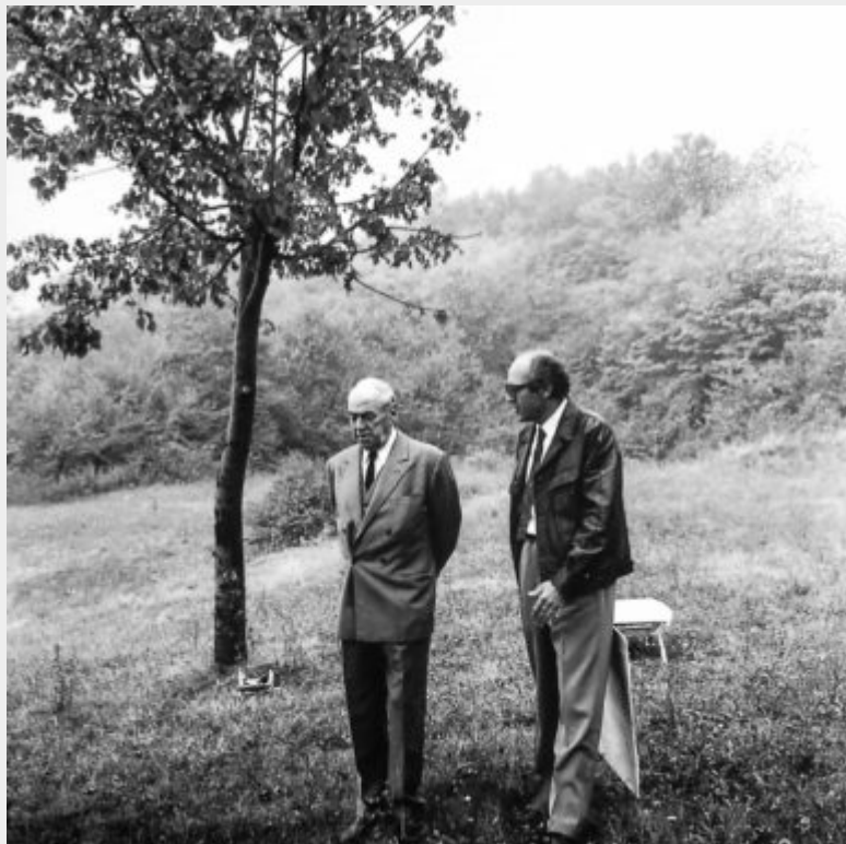
Fig. 4 - Aalto e Leonardo Mosso a Moncalieri durante un sopralluogo sul terreno di villa Erica.

rivelazione, di sistemazione e di ricostruzione dall'interno, e quindi dalla realtà stessa dei suoi lavori, dall'impianto complessivo della sua grande ricerca logica e costruttiva" (Mosso, 1964). Si deve difatti a Mosso la partecipazione di Aalto a una serie di documentate conferenze a Torino, Genova, Milano e Roma promosse nel 1956 dalle sorelle Antonetto dell'Associazione Culturale Italiana (ACI) che consentono al maestro scandinavo di instaurare un primo proficuo contatto professionale con l'Italia (fig. 4). [8]