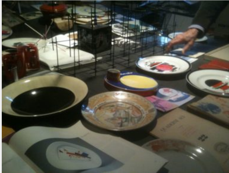
Fig. 13 - Collezione di ceramiche d'uso russe e italiane, anni Venti, conservato negli ambienti dell'Istituto Alvar Aalto Museo dell'Architettura e delle Arti Applicate di Pino Torinese.

La biblioteca dell'Istituto, infine, conta più di 20.000 volumi e numerose raccolte. Si distinguono al suo interno la sezione della "biblioteca finnica", una delle più complete esistenti fuori dalla Finlandia, la sezione sull'architettura popolare, sul costruttivismo internazionale e sulle copertine d'autore e d'artista. Proprio legata a questo ultimo settore ha avuto luogo la mostra L'arte del Novecento e il libro (Castagno & Cavaglià, 2004)[20] (fig. 14) dedicata al lavoro che pittori, scultori, architetti del Novecento, hanno destinato alle copertine di libri, riviste e pubblicazioni. Sono presenti copertine firmate da molti dei protagonisti dei movimenti artistici che hanno segnato le arti del Novecento, dalle avanguardie storiche fino agli sviluppi più attuali dell'arte contemporanea, tra i quali Fausto Melotti, Fernand Léger, Le Corbusier, Max Ernst, Henri Matisse, Carlo Mollino, Alvar Aalto, Gino Severini, Sonia Delaunay, Andy Warhol, Giulio Paolini, Tapio Wirkkala, Reima Pietilä, Bruno Munari, Felice Casorati, Arrigo Lora Totino, Sandro De Alexandris, Nicola Mosso, Leonardo Mosso, Laura Castagno. L'esplicito obiettivo è proporre la realizzazione di una pinacoteca in piccolo formato che copre tutto l'arco del secolo, in una logica di democraticizzazione dell'arte "alta".