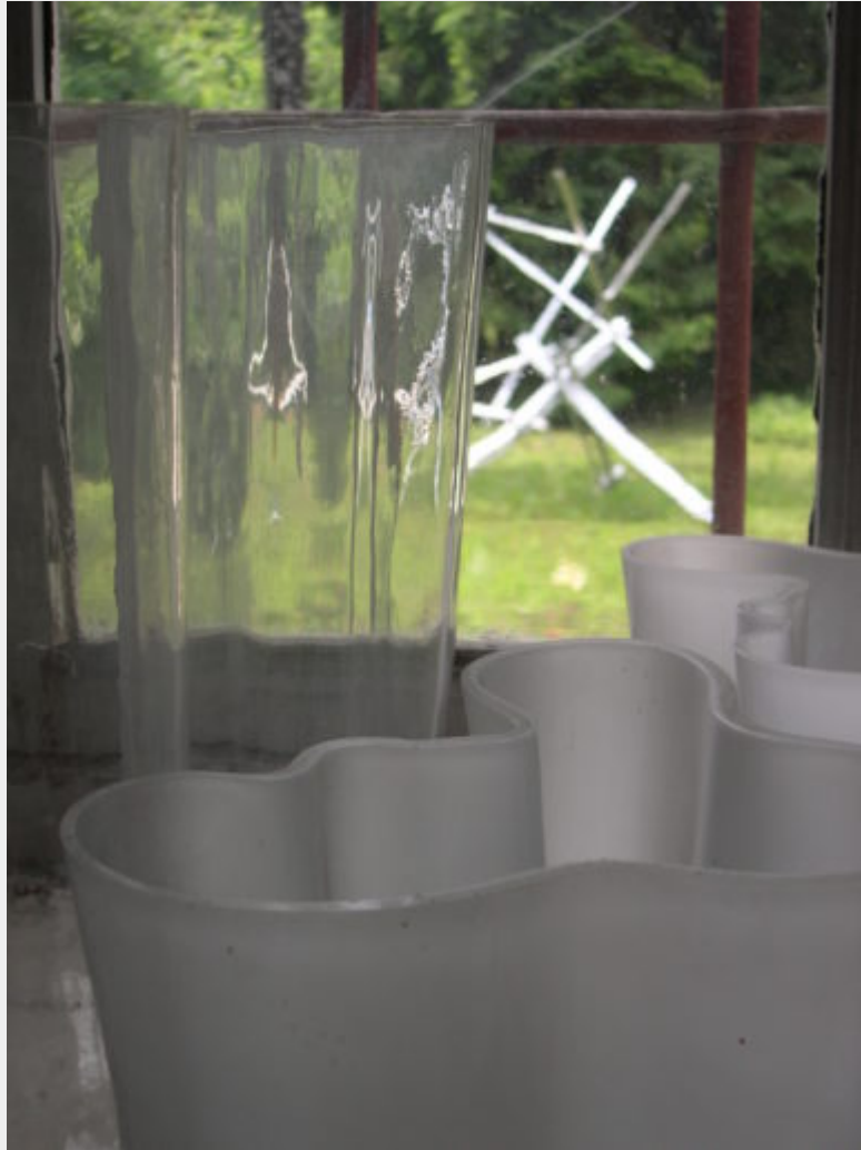
Fig. 5 - Alcuni modelli di vasi "Aalto", anche noti come "Savoy", disegnati da Alvar Aalto nel 1936 per Karhula-Iittala; sullo sfondo strutture luminose opera di Leonardo Mosso nel giardino della Ca' Bianca a Pino Torinese / fotografia T. Marzi.

In particolare, è proprio il ruolo di congiunzione tra Finlandia e Italia acquisito dall'architetto italiano nel decennio compreso tra gli anni cinquanta e sessanta e le conoscenze instaurate da Mosso nell'ambito della collaborazione delle Edizioni di Comunità [9] che nel 1965 inducono Carlo Ludovico Ragghianti a sceglierlo quale curatore della mostra sulla produzione aaltiana (1918-1970) organizzata a Palazzo Strozzi, a Firenze, e del catalogo L'opera di Alvar Aalto (Mosso, 1965). Questo episodio, al pari della mostre dedicate a Wright (1950) e a Le Corbusier (1963), dalla metà del XX secolo riscuote un tale successo da condizionare le scelte progettuali e urbanistiche e innescare un rinnovato interesse per la sua opera e il moltiplicarsi di incarichi nazionali.[10] Nonostante l'interesse suscitato, però, degli otto progetti italiani