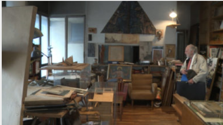
Fig. 10 - Studio della Casa-Studio di Nicola Mosso in via Grassi a Torino, sede decentrata dell’Istituto Alvar Aalto. Tavolo-scrivania progettato da Nicola Mosso per la Triennale di Milano del 1936, prototipi di poltrone, opere e sculture del periodo Futurista. Fotogramma tratto dal film documentario Leonardo Mosso. Un secolo in un giorno realizzato dall’Ordine degli architetti di Biella, 2016.

Il complesso della casa-studio (fig. 10) è arricchito da quadri, sculture, disegni, corrispondenza, grafiche e documenti di artisti, architetti e designer del periodo Futurista e successivi (tra cui opere pittoriche e scultoree di Diulgheroff, Fillia, Pozzo, Terracini, Zucconi, Pistarino), fotografie di Ernie, l’archivio fotografico di Giulia Veronesi, numerosi oggetti di design internazionale quali vetri finlandesi (disegnati tra gli altri da Tapio Wirkkala, Timo Sapaneva, Kaj Franck, Alvar Aalto, Nanny Still) e ceramiche danesi degli anni cinquanta, che testimoniano i rapporti di amicizia e di collaborazione di Mosso con gli artisti del suo tempo.