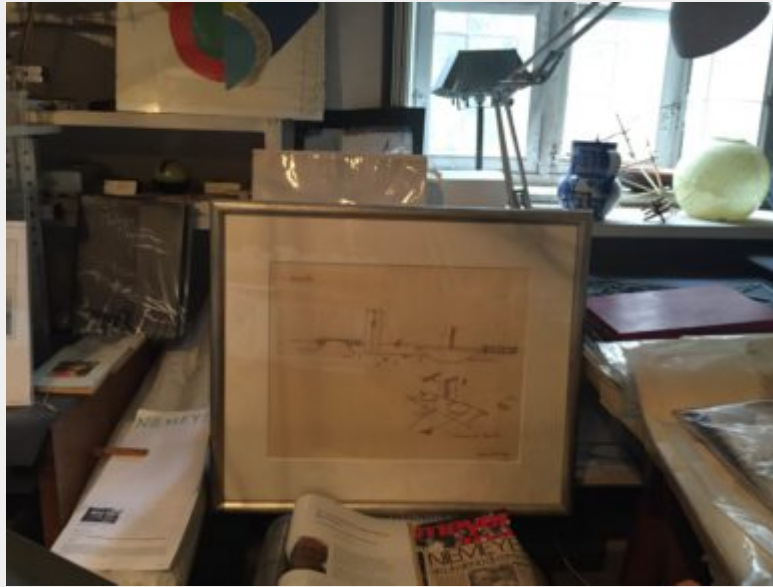
Fig. 3 - Disegni originali, scritti e fotografie di Oscar Niemeyer / fotografia F. Stella.

Mosso, carattere suggestivo quanto sfumato che richiederebbe ulteriori riflessioni relativamente al tema della fruibilità.