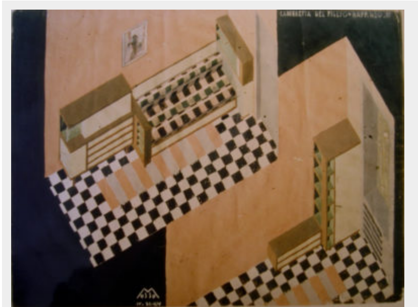
Fig. 9 - Nicola Mosso, Cameretta del figlio , 1936, bozzetto a matita e gouache su carta. Collezione Nicola Mosso, in deposito presso Istituto Alvar Aalto, Pino Torinese.

Vi è poi l'ampio studio con una grande biblioteca, un'intera parete-scacchiera di lastre di marmi diversi, finestre angolari continue, l'insieme di mobili da ufficio realizzati per il Concorso per una scrivania e relativa sedia o poltrona della Triennale di Milano del 1936. In questa stanza emerge l'impegno scientifico in campi progettuali poco esplorati: dalla matematica, all'astronomia, al soleggiamento degli edifici (Mosso, 1961). Nello stesso ambiente si trova l'attrezzatura tecnica, gli archivi dei disegni, delle fotografie, delle pratiche e dei materiali, la biblioteca scientifica e personale e un corpus di disegni di Michele Frapolli. Qui è conservato l'archivio integrale di Nicola Mosso (60.000 disegni di architettura), in cui lo stesso architetto archiviò cronologicamente tutti i progetti, come i più noti per Casa Barberis ad Asti (1925), la stazione ferroviaria di Cossato (1932) - una delle più interessanti architetture italiane prebelliche purtroppo andata distrutta, che venne esposta a Londra alla mostra internazionale di architettura del Royal Institute of British Architects del 1934 -, il Piccolo Albergo di mezza montagna, medaglia d'oro alla V Triennale di Milano del 1933, Casa Cervo a Biella (1934), e la sede dell'Unione Industriale Biellese del 1937.