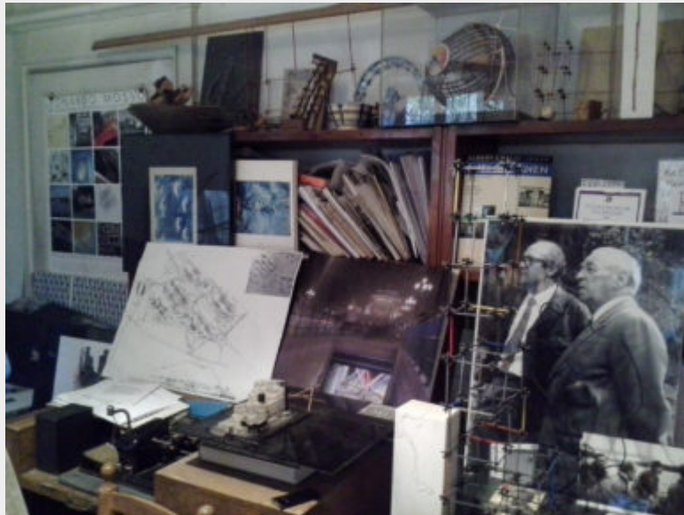
Fig. 1 - Immagine di parte degli eterogenei elaborati conservati presso l'Istituto di Pino Torinese che documentano la collaborazione tra Aalto e Mosso / fotografia F. Stella.

padre di Leonardo, architetto vicino al gruppo del MIAR torinese (Pagano, Aloisio, Passanti, Sottsass sr., Cuzzi, Levi-Montalcini) (Viglino, 1974, 2010; Montanari, 1992), si è rivelato negli anni il collante e collettore per documenti di vario genere. Il centro infatti conserva una delle più complesse e articolate raccolte di elaborati progettuali, lettere, libri, riviste, opere pittoriche e scultoree, fotografie, manufatti, oggetti d'uso anonimi e d'autore, arredi, plastici, ritagli di giornale ed eterogenei materiali ascrivibili a molteplici collezioni di architettura, arte, design afferenti al Movimento Moderno e ai suoi esiti più o meno ortodossi degli anni cinquanta e sessanta del secolo scorso (figg. 1-2).