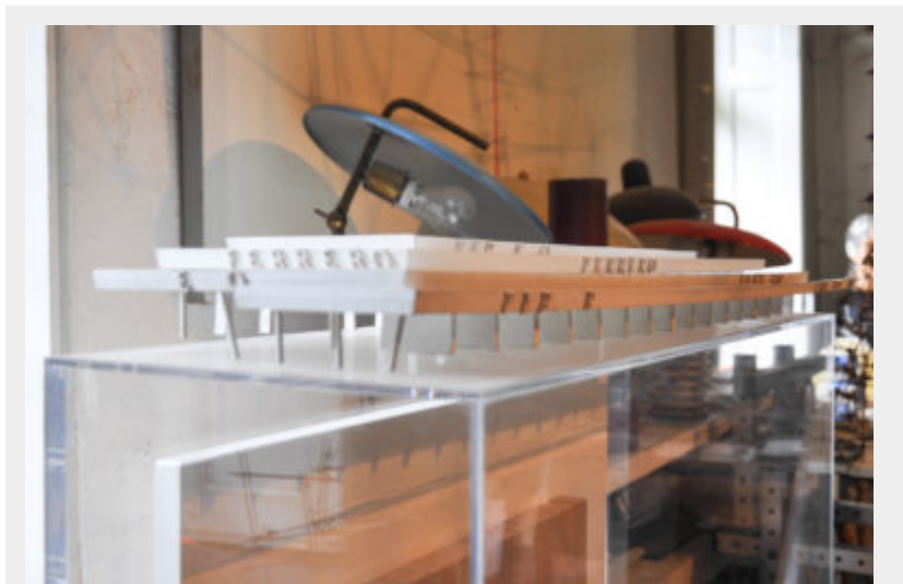
Figg. 6-7 - Particolari di uno dei modelli del prototipo di filiale e magazzini Ferrero Co. In primo piano saggi di sfibratura e piegatura del legno per le produzioni Artek, conservato negli ambienti dell'Istituto Alvar Aalto Museo dell'Architettura e delle