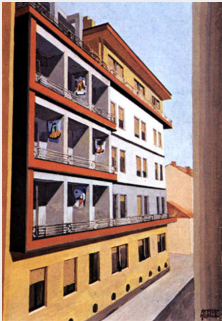
Fig. 11 - Nicola Mosso, Progetto per Casa Cervo a Biella , Veduta prospettica con inserimento delle plastiche murali nelle logge, 1934. Collezione Nicola Mosso, in deposito presso Istituto Alvar

della Casa Cervo di Biella (1934), architettura cubo-futurista progettata da Nicola Mosso (fig. 11), perfetto esempio di integrazione delle arti. Si conserva il corpus integrale dei bozzetti futuristi su temi legati ai simboli del territorio biellese, alla natura, alle fabbriche, e un prototipo - modello al vero di plastica murale - raro esempio di opera polidisciplinare e polimaterica che non venne mai realizzato sull'edificio (fig. 12). [19] Tali disegni, realizzati "a fresco" nelle logge degli appartamenti di Casa Cervo e visibili dalla strada, risultano fruibili sia dai residenti sia dai cittadini, assumendo un certo valore pedagogico, perfetta sintesi di arte domestica e pubblica (Mosso, 2008).